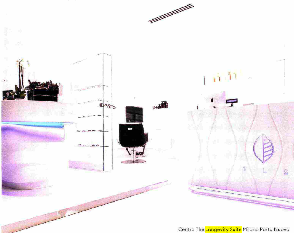
Centro The Longevity Suite Milano Porta Nuova

The Longevity Suite conquista il mercato europeo dell'antiage di lusso