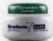
Snellente 7 Notti Ultra Intensivo Gel Fresco